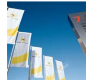
Firmensitz heute: Stettiner Straße 7, Weingarten