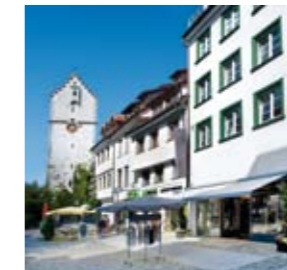
Beginn: Bachstraße 64, Ravensburg